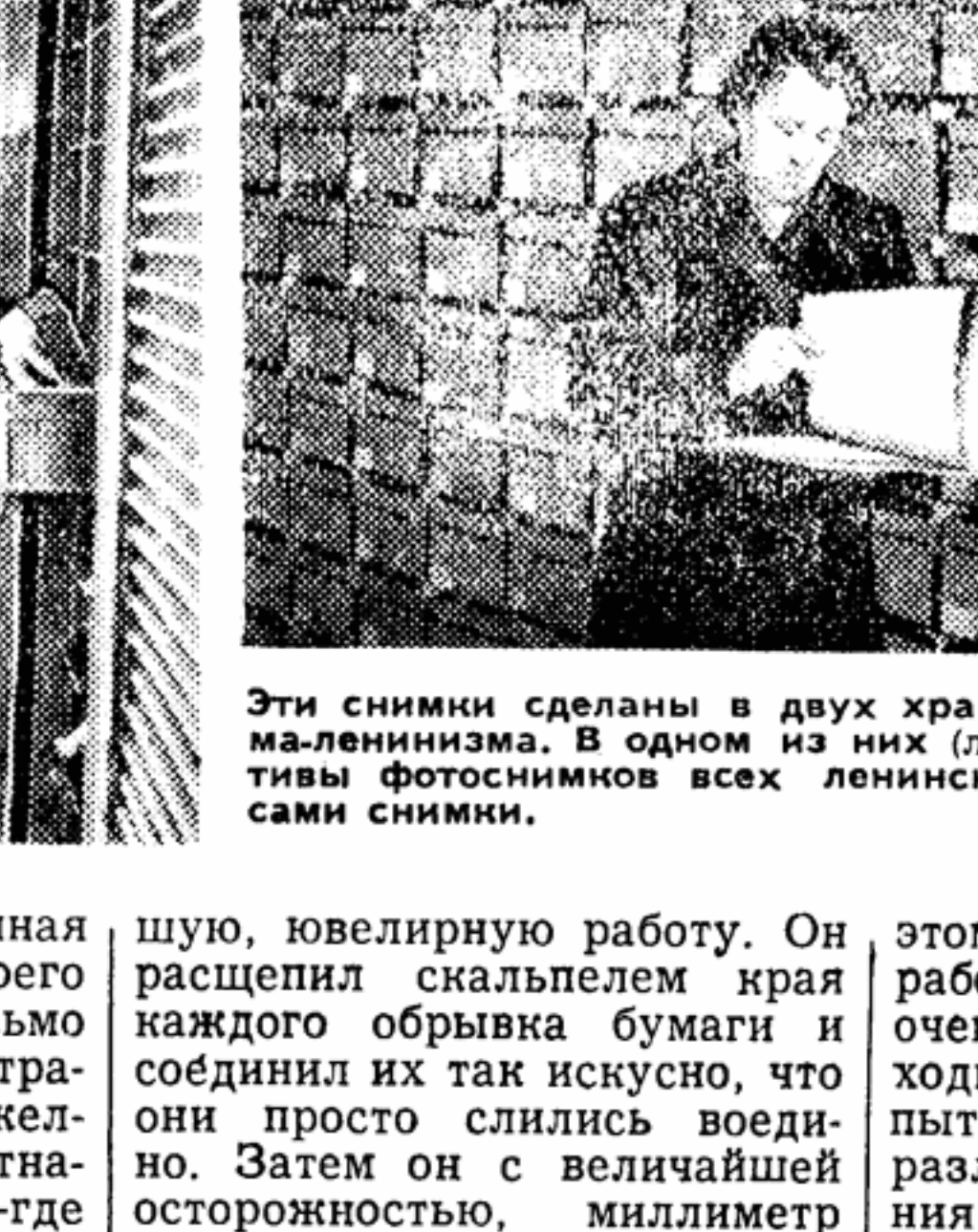
Эти снимки сделаны в двух хранилищах Института марксизма-ленинизма. В одном из них (левый снимок) собраны негативы фотоснимков всех ленинских рукописей, в другом — сами снимки.

туру, увеличивают на один процент влажность воздуха. Искусственный климат создан и в хранилище, где собраны немногочисленные, дошедшие до нас документальные фильмы о Ленине. Здесь же хранятся десять матриц звукозаписи, запечатлевших голос Ильича. В этом помещении необходимо постоянно поддерживать температуру на два градуса ниже, чем в хранилище рукописей. Поэтому пришлось установить еще один аппарат кондиционирования воздуха — специально для защиты киноплёнки от повреждений. Немало ленинских рукописей и документов было найдено и поступает сейчас в институт уже после того, как время оставило на них, казалось, неизгладимые рубцы. На протяжении десятилетий эти листочки бумаги не были защищены от самых различных повреждений. С трудом удается на желтевшей бумаге различить выцветшие буквы. В лаборатории, где реставрируют такие документы, можно увидеть подлинники чудеса. Вот несколько образцов полустаршей бумаги. На одном — едва раз-