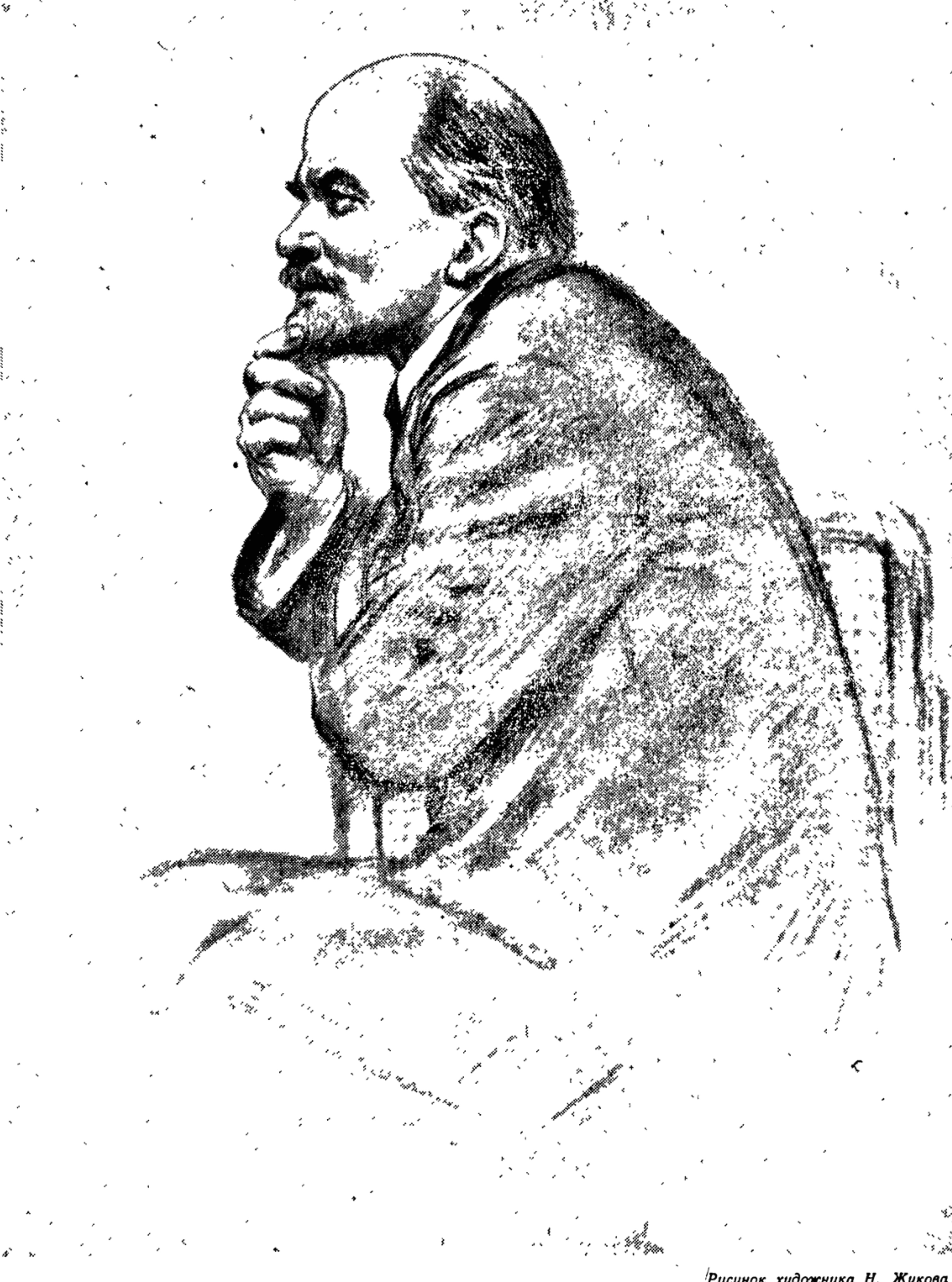
Рисунок художника Н. Жукова

И ты становился ближе энергии солнц и молний, прорезывающих ночи земную древнюю тьму, и ты становился мира величия преисполнен и сроден добру и свету, а — значит, равен ему!